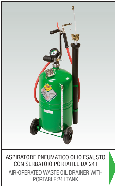
ASPIRATORE PNEUMATICO OLIO ESAUSTO CON SERBATOIO PORTABILE DA 24 l AIR-OPERATED WASTE OIL DRAINER WITH PORTABLE 24 l TANK